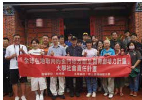
古寧頭聚落古寧歇心苑古厝人才培育工作坊