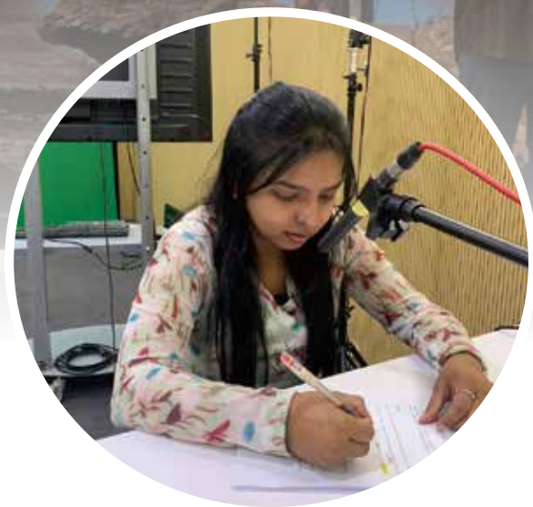
多語翻譯錄音室現場