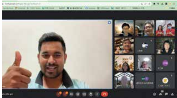
線上學堂印度成員

希望可以記錄下金門文化血脈在不同地域發展的軌跡與豐富樣貌，也藉由充實金門歷史民俗博物館館藏，以提升金門博物館國內外之能見度。此外，本團隊也舉辦「The Chinese Question: The Gold Rushes and Global Politics（華人問題 - 淘金熱與全球政治）」講座，邀請美國哥倫比亞大學歷史學系艾明如教授至臺師大演講，藉由對華人移民研究的剖析與反思，套用到現今國際局勢下的類比，使參與講座的師生對全球華人移民研究產生新的觀點，同時正視文化多元與文化永續等相關的課題。