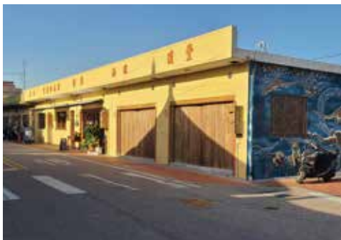
瓊林聚落夏雨聲植物X茶點職人手作