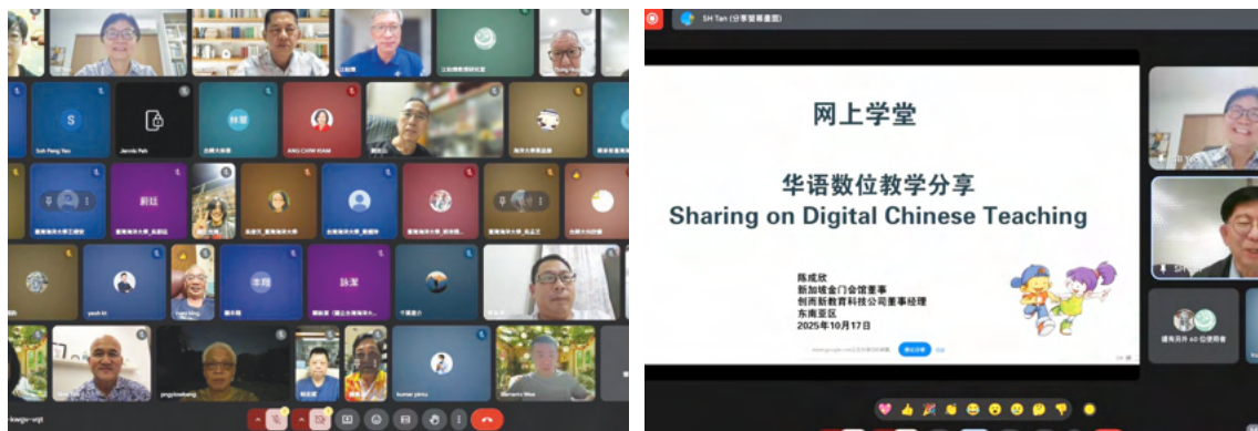
第五屆線上學堂公眾熱情參與

本屆線上學堂由計畫團隊與新加坡金門會館、馬來西亞雪蘭莪金門會館、柔佛州金同廈會館、林夢市區睦鄰會、汶萊福建會館、印尼廖省及廖省島金門鄉親會、泗水金門會館等社團共同協辦，規劃出為期五周（114年9月19日至10月18日）、十場講座的安排，活動期間累計吸引978人次上線聆聽，直播影片上傳團隊經營的臉書粉絲專頁後，截至115年1月27日止，也有超過12,000人次觀看，除了金門、臺灣的聽眾外，更有來自印尼、新加坡、馬來西亞、越南、日本等地的鄉親與學生上線參與，為全球華人社群注入新能量，也為文化傳承開啟嶄新篇章，建立起有深度、溫度的文化交流。