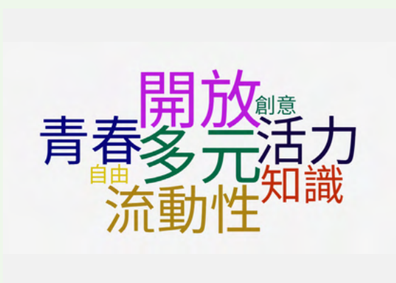
大學城區域學生人口給商號的感覺