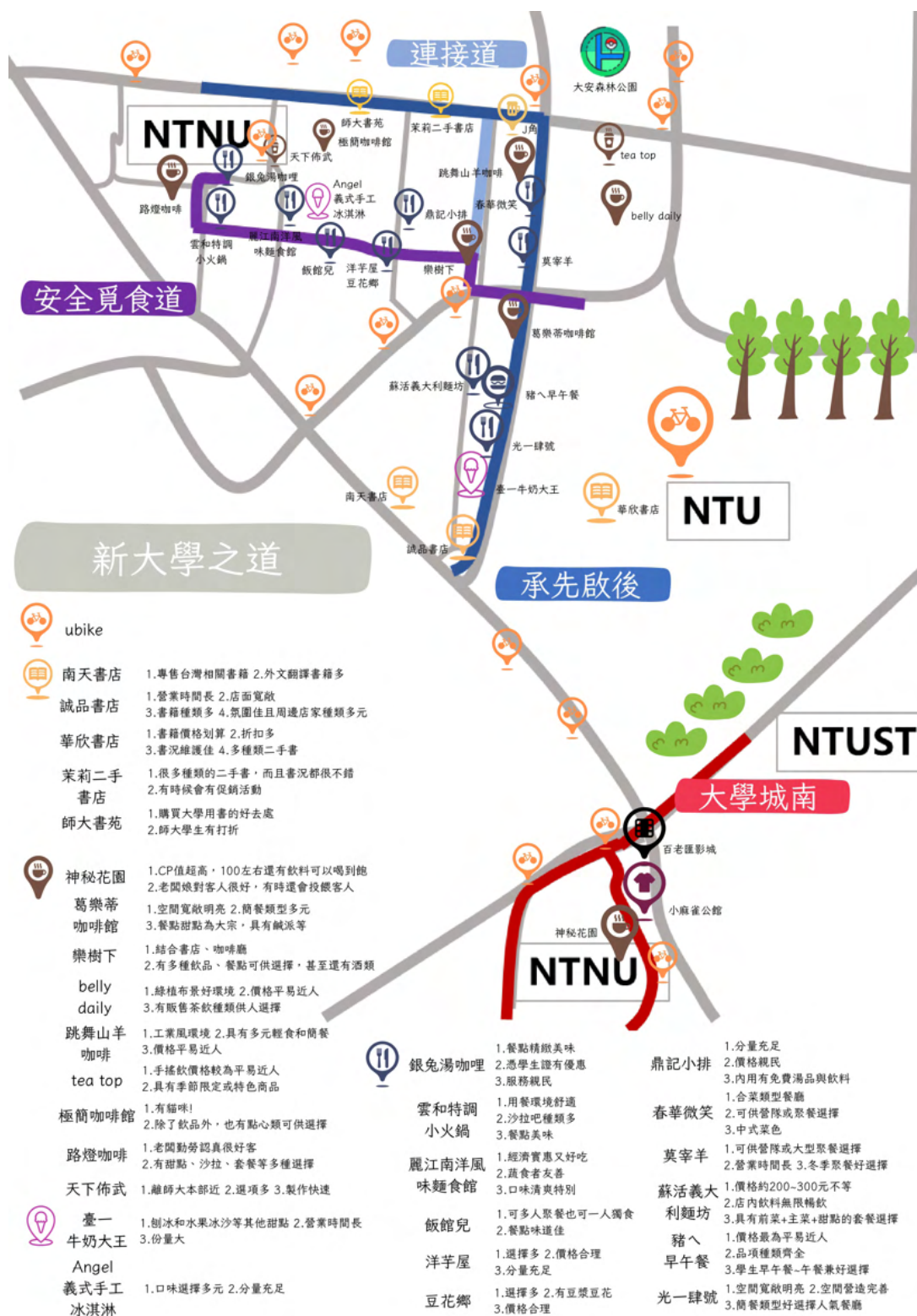
大學城周遭之資源整合 (海報作者為圖內所示學生名單)