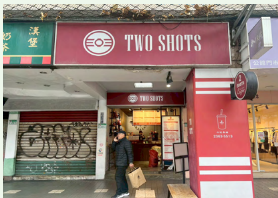
通學路經外帶咖啡之店家