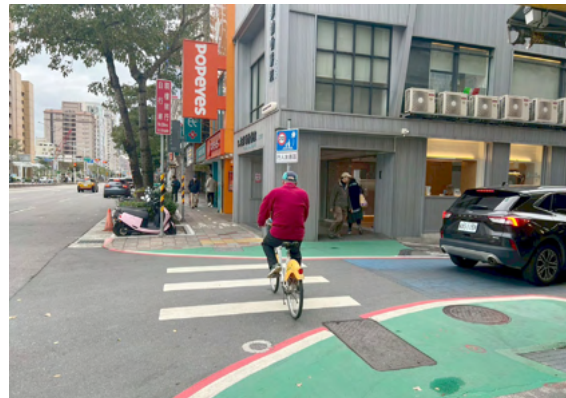
單車騎乘於枕木紋線與行人爭道