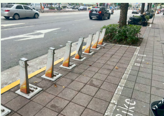
位於羅斯福路UBike站_缺車中