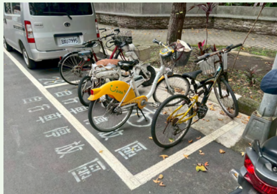
可見之單車停置空間