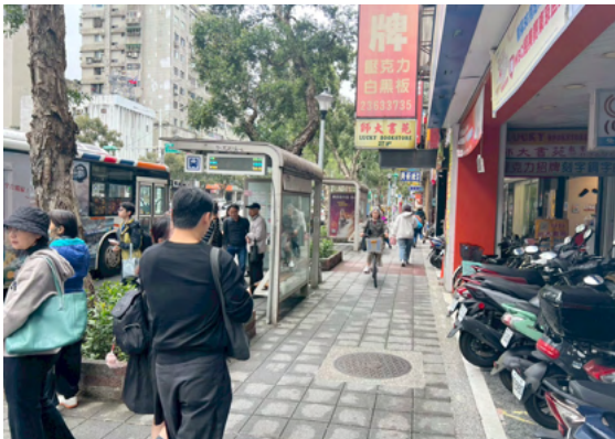
人車爭道與公車亭空間壓縮狀況

此外，公車亭等設施在部分路段也壓縮行人與單車的通行空間，使人車衝突顯著。依規定，單車於特定人行空間應下車牽行，但在實際通行過程中，此一規範往往難以落實；其關鍵並非使用者守法意識不足，而是牽行造成的通行中斷，與通勤行為所追求的連續性與效率有著明顯的落差，而使違規成為日常情境的常態選擇。