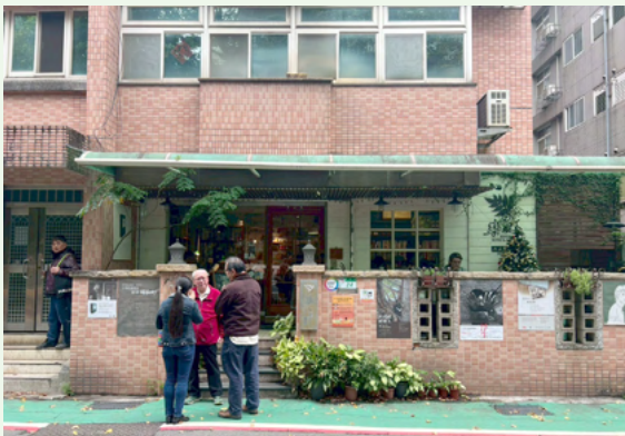
位於大學之道的樂樹下咖啡屋