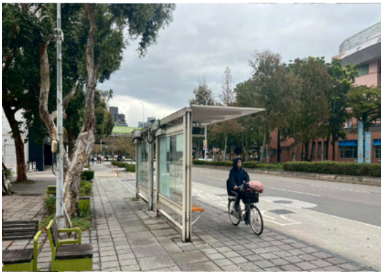
單車違規行經公車亭空間