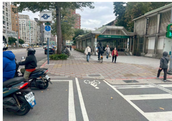
單車道設計之銜接不連續