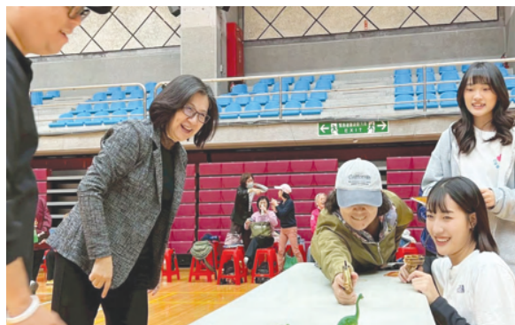
全齡運動會由跨世代組隊，挑戰體適能及童玩遊戲，促進世代共融