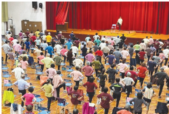
「銀領健康浪潮」大型社區健康促進方案服務6千餘位社區高齡者

4.敘事力策展： 於114年10月1日、10月15日、11月5日及11月19日辦理4場圖像故事力工作坊，訓練高齡者基本的圖像敘事力，並創作生命敘事畫作。在課程結束後，與大安區古風里古厝據點合作，於12月3日至4日辦理「圖像故事力：用畫留聲 時光正響」策展，共16位高齡者，透過「基礎嘗試」、「成就延續」、「起點看見」、「探索記憶」四大主題展區，展出31幅生命敘事圖像創作，除了展現高齡者的學習成果，也與社區民眾、臺師大師生及親友，分享個人寶貴的生命經驗，呈現正向而積極的高齡文化。