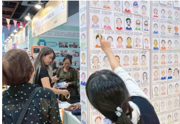
計畫團隊參與資訊月「臺灣教育科技展」展現數位包容與創齡成果，與現場民眾熱情互動