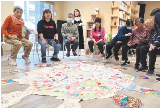
跨世代社會情緒學習工作坊幫助高齡者重新建構自我價值感，強化溝通與情緒連結

3. 社會實踐人才共備： 114年6月19日至20日與國立宜蘭大學休閒產業與健康促進學系合作，至宜蘭五結鄉辦理高齡人才共備暨青銀共學活動。本活動已辦理第2年，首次結合在地學生社團能量，提供返鄉服務機會並擴展社團經營發展面向。本計畫團隊共5位行政人員、6位銀齡樂活據點高齡者、加上6位宜蘭大學學生、17位五結鄉在地長者及4位宜花數位機會中心夥伴，共計46位共襄盛舉。本計畫亦持續於宜蘭地區辦理體適能活動，114年度共辦理99場、服務五結及蘇澳地區20個社區、2,970人次高齡者。