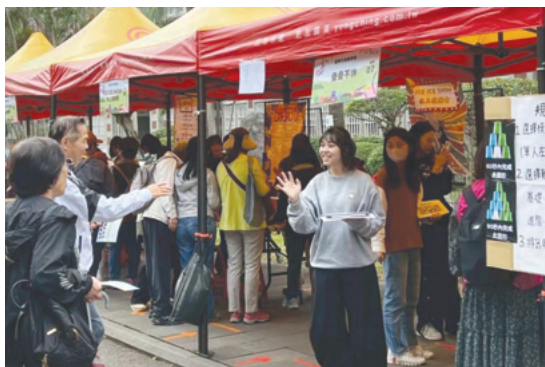
高齡夢想市集活動由學生、社團、夥伴學校及產業界共同參與，提供高齡者及社區民眾互動交流機會