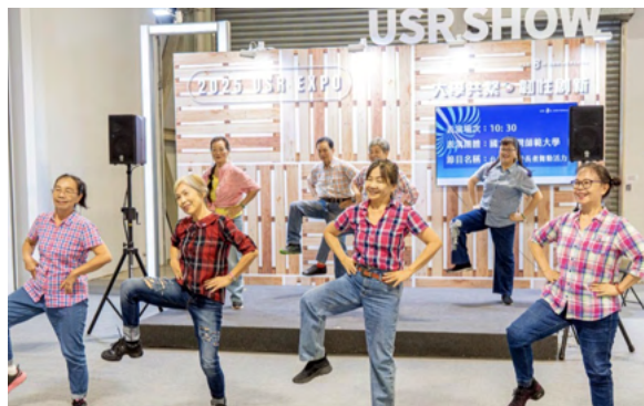
銀齡樂活據點運動班長者熱情參與USR EXPO演出活動