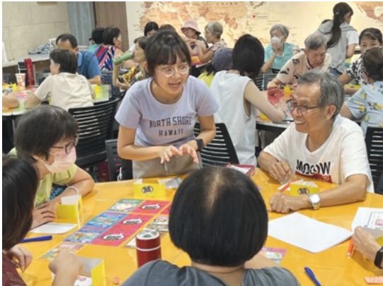
辦理「青銀玩人情、桌遊傳心聲」活動，透過青銀共學模式，思辨校園人權與霸凌議題