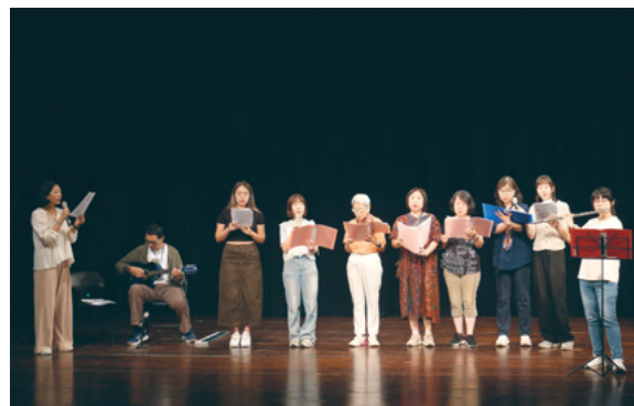
讀劇音樂會與國立教育廣播電台合作，成功跨越校園邊界，促進社區與校園之間的跨世代理解