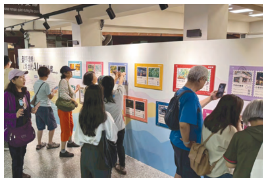
「聲影流轉——跨世代AI聲景計畫」結合NFC技術讓參展民眾也能聲歷其境