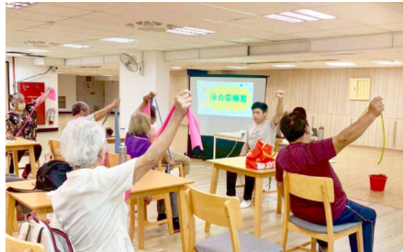
「社區高齡者服務實習」課程學生結合系所專業設計方案至社區據點服務