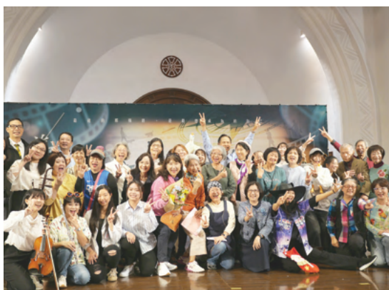
前方的旅人——微型音樂劇於本校禮堂盛大公演，探討不同生命階段的自我反思

3. 全齡運動會暨高齡夢想市集 ：一年一度「高齡夢想市集」邁向第9年，於114年11月22日在禮堂周邊熱鬧展開！攤位、人潮與笑聲從早持續到午後，超過 750 位高齡長者、社區民眾、師大師生與合作夥伴共同參與，讓校園洋溢著溫暖又有活力的氛圍。今年的活動亮點，是下午首次登場的「全齡運動會」。參賽隊伍由65歲以上的高齡者、45到65歲的中高齡者，以及45歲以下的年輕人組成，超過 20 支隊伍、平均年齡 71 歲的銀髮選手，以最認真的態度和最燦爛的笑容，把體育館變成最動人的競技舞台。