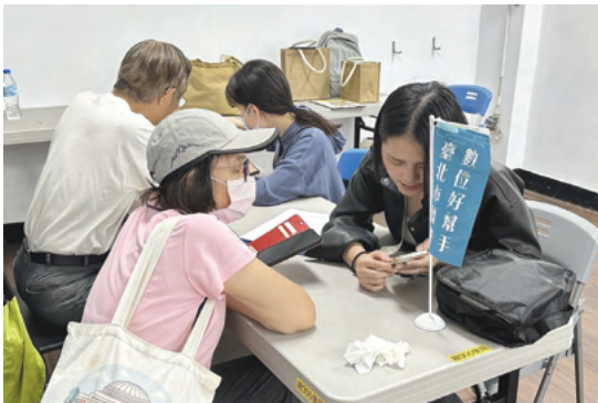
學生提供社區民眾數位諮詢服務，並導入常見生活議題宣導