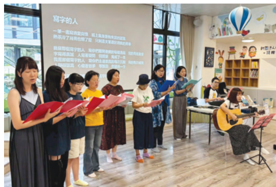
羽芬的筆心——讀劇音樂會為擴大教育影響，與公共文化場域共同推動創齡方案