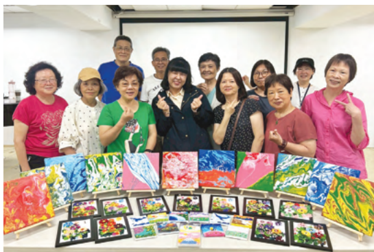
銀齡樂活據點藝術手作課程，透過創齡方案讓高齡者從藝術中涵養美學素養