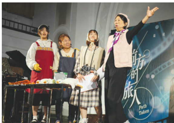
跨世代共創微型音樂劇展現藝術結合生命教育、世代共融與終身學習的公共教育價值