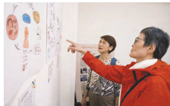
「圖像故事力：用畫留聲 時光正響」策展讓高齡者用圖像訴說生命故事