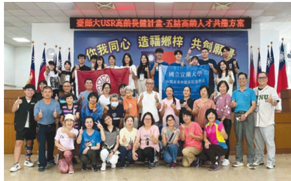
與國立宜蘭大學合作，至宜蘭五結鄉辦理高齡人才共備暨青銀共學活動