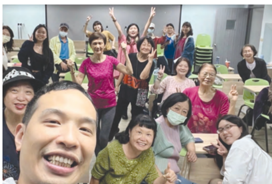
本校「數位創齡行動家」團隊獲《親子天下》「教育創新100」肯定