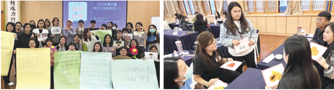
慈濟華語文國際教學志工培育工作坊