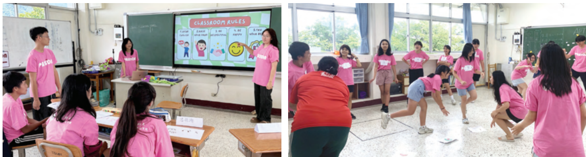
越南丁善理紀念中學國際志工全英語教學剪影