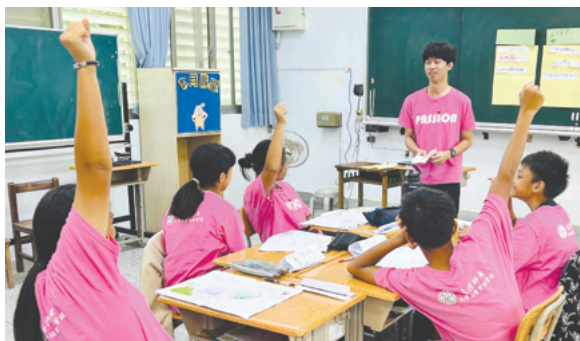
PASSION暑期實習課程剪影