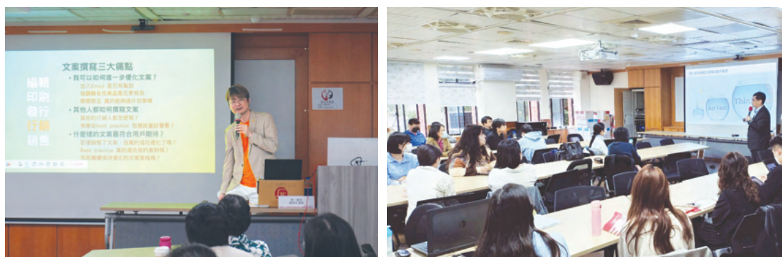
科技化教學產業學分學程課程剪影

此外，課程也促使學生重新思考未來的教育角色與生涯方向：「這門課讓我更確定自己想走教育這條路，也希望未來可以回到偏鄉做資訊教育，當一個引路人，讓偏鄉學生更早認識資訊領域，啟發他們的興趣。」