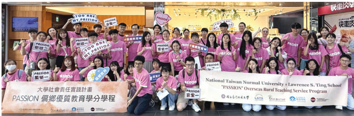
PASSION學分學程暑期實習與越南丁善理紀念中學國際志工聯合出團大合照

在實習歷程中，修業生也逐漸體會到未來進入教學現場所需具備的核心素養，如耐心、愛心、信心與熱情等。「學生學習意願較弱，需要更多時間等待與陪伴。」也有人談到：「在獲得學生信任之後，他們更容易聽進對成長有幫助的建議。」面對偏鄉教育的挑戰，亦有人反思：「偏鄉教育挫折感可能更高，因此教師需要對自己與學生保持信心。」同時也提到：「備課與授課都需要投入很大的心力，唯有持續的熱情，才能支持自己長時間投入教育工作。」