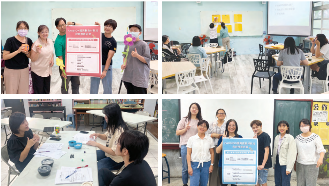
本計畫定期邀請專業講師辦理增能研習，協助合作學校教師提升教學能力並熟悉PASSION教學模組

截至目前，計畫已診斷海內外學生112,463人次，開設2,102班國英數扎根班，服務學生14,779人次，並培力教師5,470人次。114年度於實踐場域完成學生診斷8,450人次，開設196班扎根班，服務學生1,304人次，並增能教師766人次。此外，PASSION教學模組亦由學習扶助課程延伸至日間課程，以強化合作學校整體教學效能。在學習成效方面，各學齡層（五至八年級）學生於國文、英文與數學皆呈現穩定進步。以113學年度為例，國文閱讀能力進步學生達五成以上之學校占45%；英文詞彙進步學生達五成以上之學校逾80%；數學進步學生達五成以上之學校亦占45%，顯示教學模組在提升學習表現上具穩定成效。