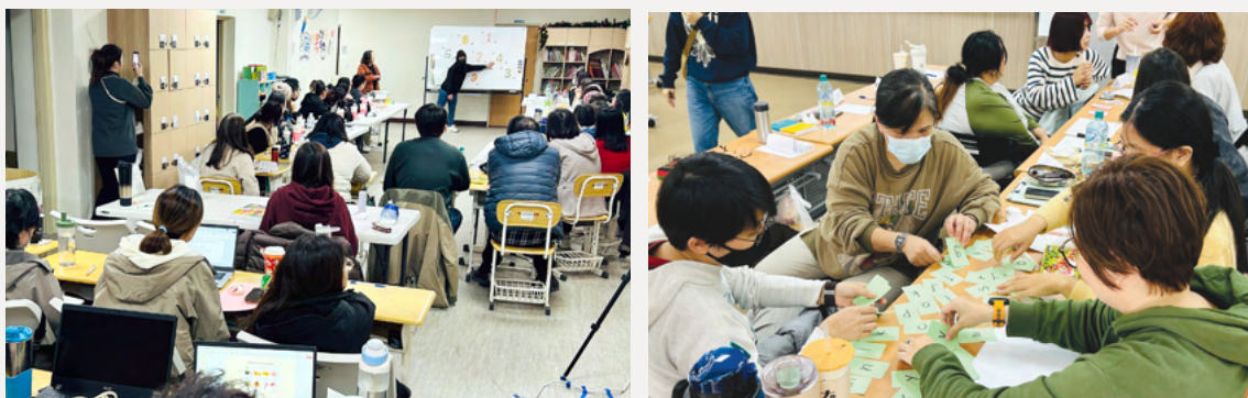
博幼基金會導入PASSION教學模組，深化教學品質，實現在地扎根的理念