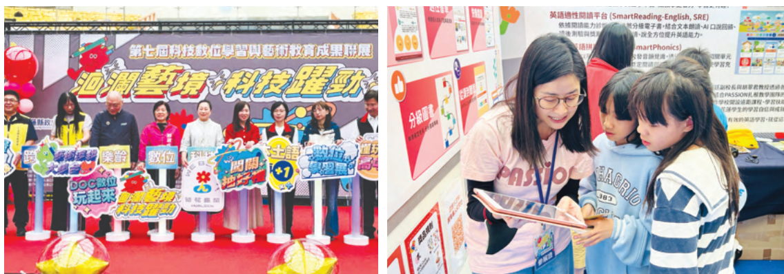
本團隊受邀參與花蓮科技數位學習與藝術教育成果聯展

本團隊於105年至114年間持續與教育部國教署、美國在台協會等公部門合作，共同致力於提升花東等偏鄉地區學習扶助的教學品質。國教署亦持續挹注