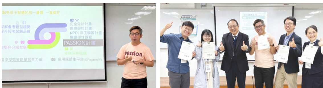
偏鄉教育論壇邀請合作學校校長、PASSION學分學程學友分享實踐經驗與心得

本計畫持續參與「臺灣教育學術聯盟」(Taiwan Education Alliance, TEA)之「偏鄉教育小組」，與中央、屏東、慈濟、彰化師範、暨南國際、臺南及輔仁等大學建立長期交流與合作關係，透過跨校協作共同推動偏鄉教育議題。114年並與慈濟大學共同舉辦第四屆「偏鄉教育論壇」，邀集大學、中小學與非營利組織等38個單位，共198人次參與。論壇透過經驗分享與議題討論，促進學界與實務現場對偏鄉教育發展的關注與交流。未來亦將持續拓展與SIG大學之間的互動與合作形式，透過跨校合作與資源整合，發展更具綜效的偏鄉教育支持方案。