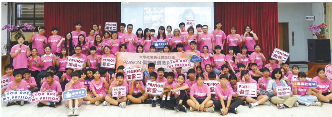
PASSION暑期實習成果展大合照