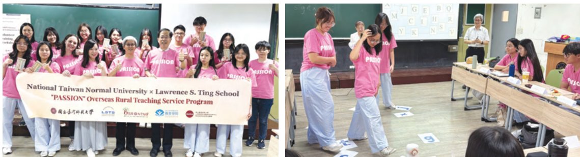
越南丁善理中學國際志工於入鄉前，在臺師大接受英語教學工作坊教學培訓

此外，本計畫亦積極推動國際志工交流，為偏鄉學生創造真實的英語學習情境。114年與越南丁善理紀念中學合作，招募學生志工於暑假來臺，接受教學培訓後進入花東偏鄉學校提供為期兩週的教學服務。本次合作共培訓11位國際志工，累計服務280課時。透過與國際志工的實際互動，學生得以在自然情境中運用英語溝通，不僅提升語言學習信心，也進一步激發學習動機並拓展國際視野。